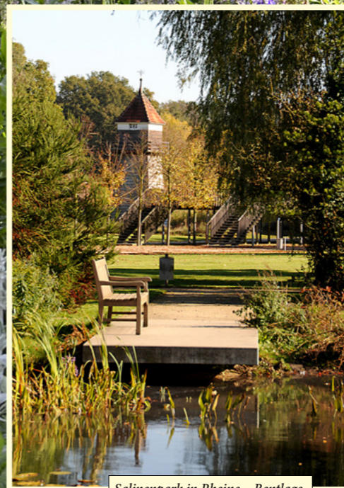
Salinenpark in Rheine – Bentlage