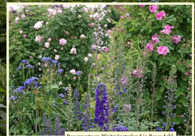
Rosenzentrum Westmünsterland in Rosendahl