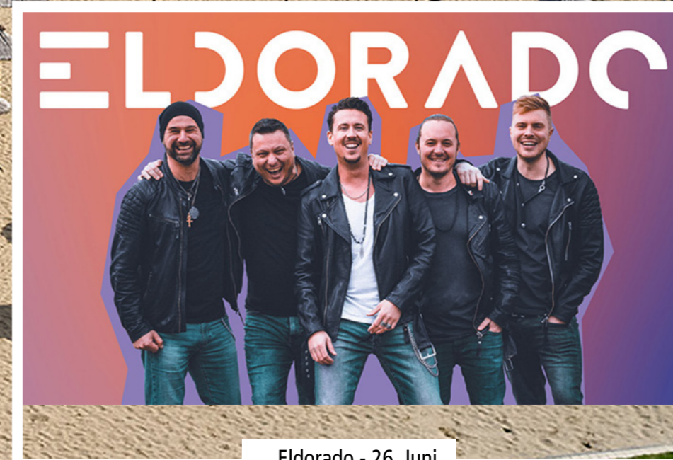
Eldorado - 26. Juni