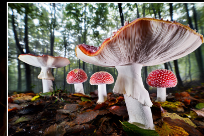
Gasometer Oberhausen ©Agorastos Papatsanis - Fliegenpilze