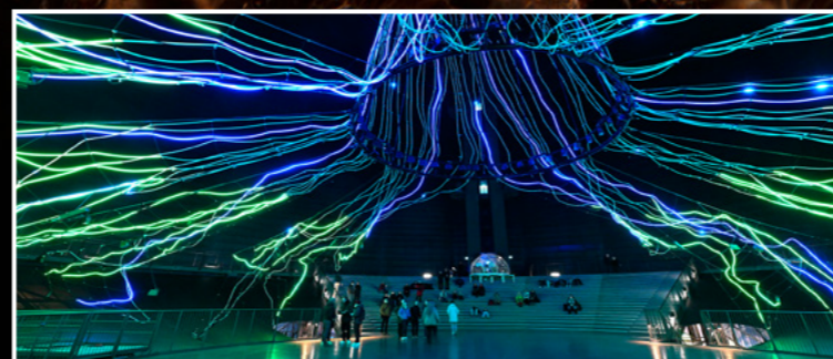
Gasometer Oberhausen · Der Baum