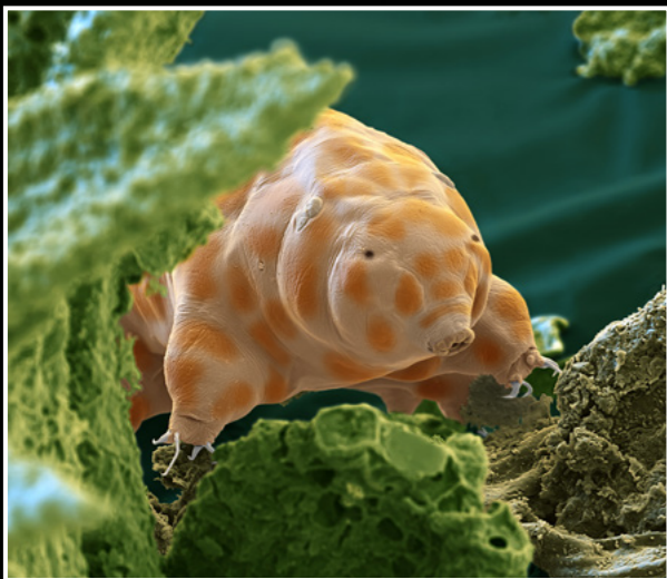
Gasometer Oberhausen © Oliver Meckes · Nicole Ottawa - Bärtierchen