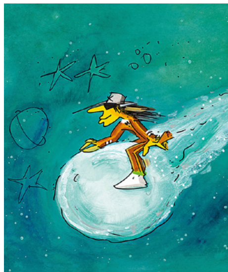
Udo Lindenberg, Komet, 2023