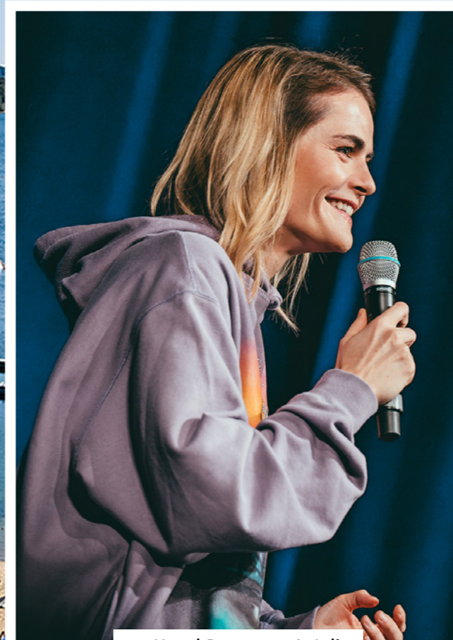
Hazel Brugger - 4. Juli