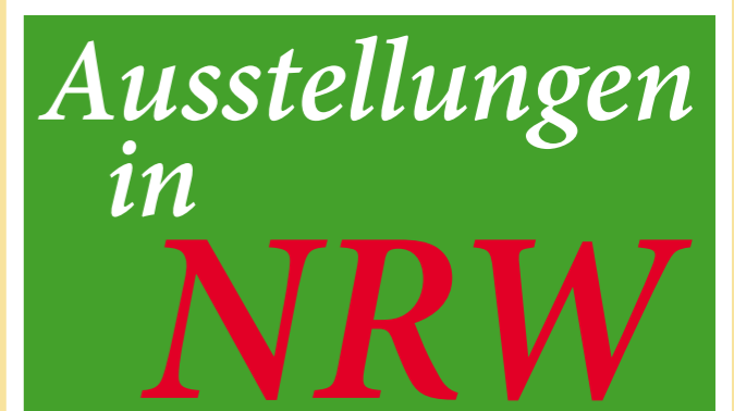
Ausstellungen in NRW