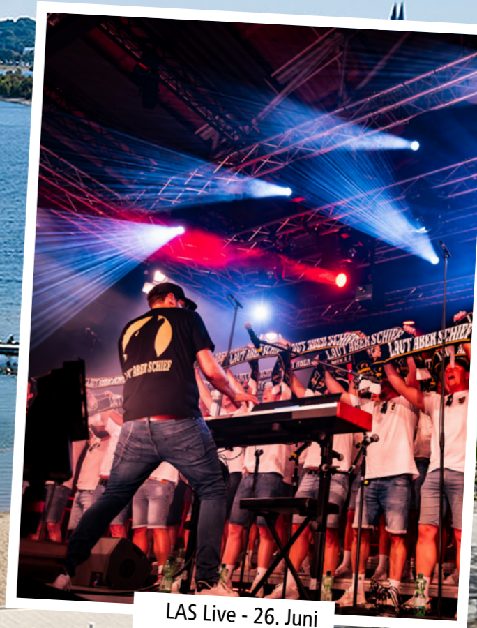
LAS Live - 26. Juni