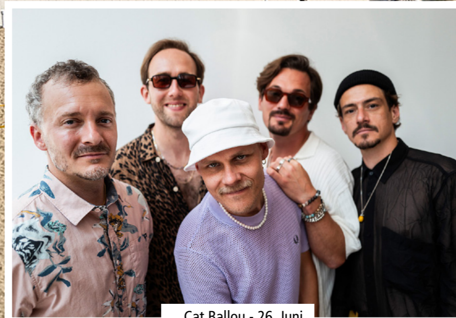
Cat Ballou - 26. Juni