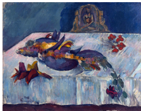
Paul Gauguin, Stillleben mit exotischen Vögeln, um 1902 Von der Heydt-Museum Wuppertal

19. Jahrhundert und in der Klassischen Moderne wird nach vielen Jahren erstmals wieder in einer dauerhaften Ausstellung und in neuer Gestalt präsentiert. Die neu konzipierte Sammlungspräsentation vereint ausgewählte Gemälde und Skulpturen vom 17. Jahrhundert bis in die 1960er Jahre – viele davon ausgesprochene Lieblinge des Publikums. Besonders ist dabei die Gruppierung der Werke: Unter dem Titel „Zeiten und Räume“ sind diese wie in einer Art visuellem Reiseführer zusammengestellt, der durch die prägenden Räume und Perioden der europäischen Kunstgeschichte der letzten Jahrhunderte führt: etwa in die Niederlande und nach Flandern, in die Kunstmetropolen Paris und Berlin oder in das unscheinbare Örtchen Worpsswede, von dem gleichwohl bedeutende Impulse ausgingen. Die Ausstellung wird also weniger eine Chronologie im klassischen Sinne aufbauen, sondern v. a. künstlerische Netzwerke aufzeigen. Zu sehen sind u. a. Werke von Ludwig Richter, Gustave Courbet, Hans von Marées, Paul Gauguin, Claude Monet, Paula Modersohn-Becker, Ernst Ludwig Kirchner, Otto Dix, Hans Arp und Alberto Giacometti. Mit über 2.000 Gemälden, 500 Skulpturen, 800 Fotografien und 30.000 grafischen Blättern verfügt das Von der Heydt-Museum über eine der bedeutendsten Kunstsammlungen Deutschlands. Ihr systematischer Aufbau begann in den ersten Jahren des 20. Jahrhunderts und dauert bis heute an.