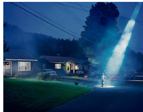
Gregory Crewdson, Untitled (Harry's Supermarket) (aus der Serie Beneath the Roses) 2003-2008 ALBERTINA, Wien, Dauerleihgabe-Privatbesitz

vielbeachteten neueren Arbeiten, die um den Niedergang der amerikanischen Gesellschaft abseits der großen Metropolen kreisen. Crewdsons unheimliche Motive sind zeitlos und zugleich von beklemmender Aktualität angesichts wirtschaftlicher und sozialer Krisen – nicht nur in den USA.