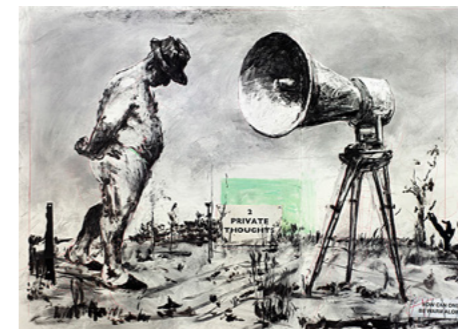
William Kentridge Drawing for Self-Portrait as a Coffee-Pot (2 Private Thoughts), 2021, Tusche, Buntstift, Kohle, Pastellkreide und Collage auf Papier 152 x 208 cm Courtesy Mark und Dana Strong Abb.: Thys Dullaart © William Kentridge, 2025

Zum 70. Geburtstag des Künstlers präsentiert das Museum Folkwang eine große Retrospektive, die mit Exponaten aus über vier Jahrzehnten die gesamte Laufbahn William Kentridges umspannt. Einen Schwerpunkt bilden die Filme der Reihe Drawings for Projection, in denen Aufstieg und Niedergang von Johannesburg ebenso zur Sprache kommen wie das schwierige Erbe der Apartheid. Auch Kentridges Beschäftigung mit dem Kolonialismus europäischer Mächte in Afrika spielt in der Ausstellung eine wichtige Rolle, insbesondere in der Zeichnungsreihe Colonial Landscapes, den Porter-Tapisserien oder der mechanischen Miniaturbühne Black Box/Chambre Noire.