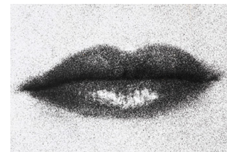
Man Ray, Lippen (Lee Miller), 1930 Print, 21 x 25,5cm, Museum Ludwig, Köln

Die Präsentation in den Fotoräumen des Museum Ludwig untersucht, wie sich unsere „Fotografiergesichter“ im Laufe der Zeit verändert haben. Sie bringt anonyme Porträtfotografien und künstlerisch gestaltete Porträts aus dem 19. bis 21. Jahrhundert zusammen zu einer Geschichte des Lächelns.