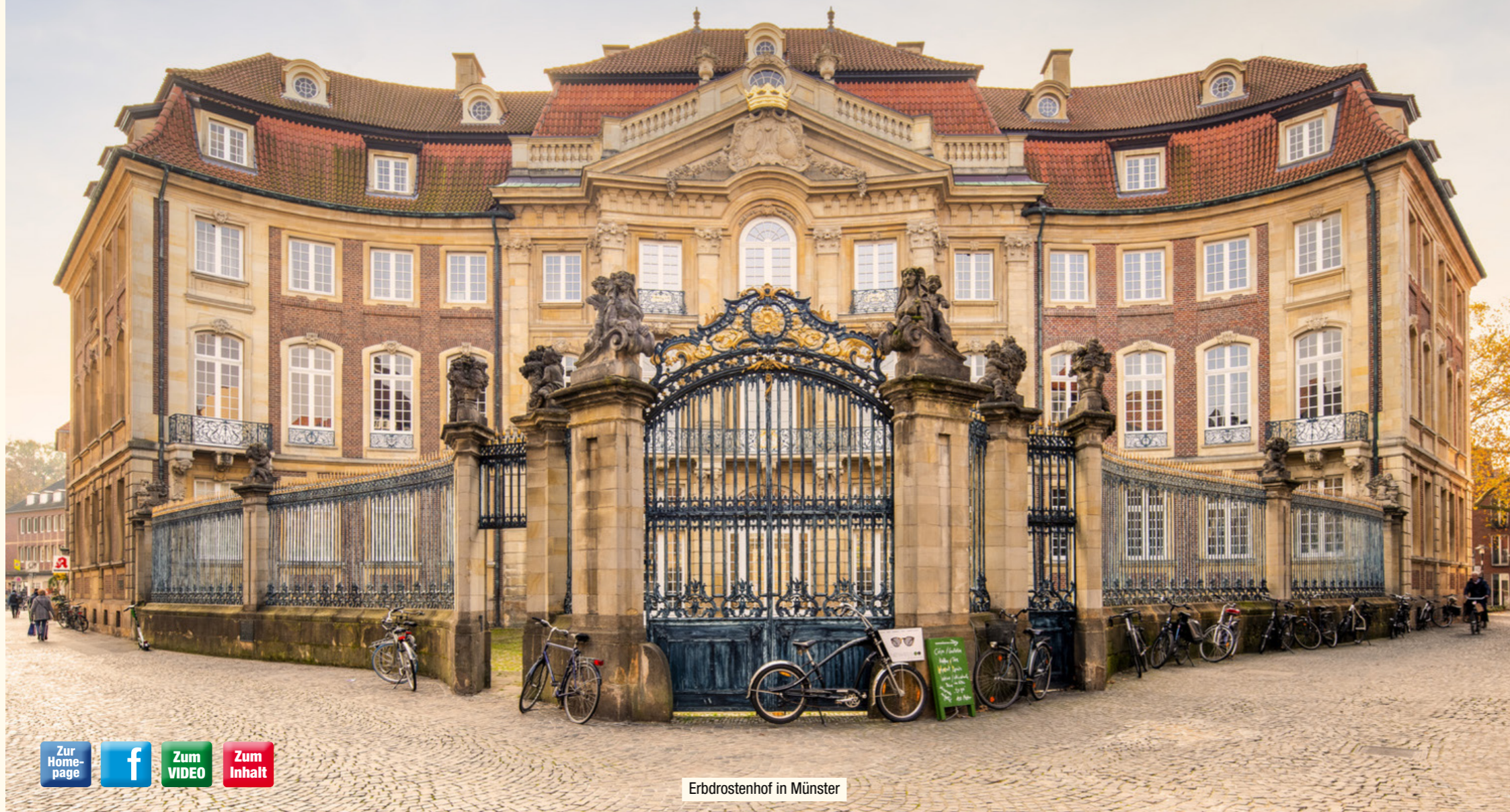
Erbdrostenhof in Münster

Über Jahrhunderte hinweg erlebte das Münsterland eine wahre Blütezeit des Schlösser- und Burgenbaus. Es entstanden zeitlose Baudenkmäler, deren stilistische Spanne von der mittelalterlichen Festung über Renaissance-Anlagen bis hin zum prächtigen Barockpalais reicht. Mehr als 100 Anwesen in der malerischen münsterländischen Parklandschaft wollen entdeckt werden: Einige davon sind fest etablierte Anziehungspunkte in öffentlicher Hand, die intensive Einblicke gewähren und viel Programm bieten; bei anderen, rein privat genutzten Adelsitzen fasziniert die Außenansicht, die auf Spaziergängen oder bei Fahrradtouren genossen werden kann.