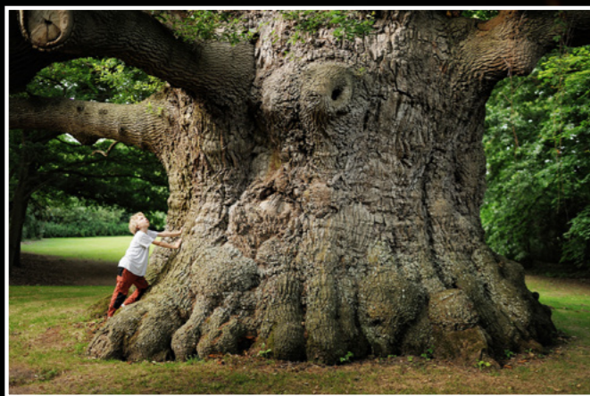
Gasometer Oberhausen Majestät Eiche