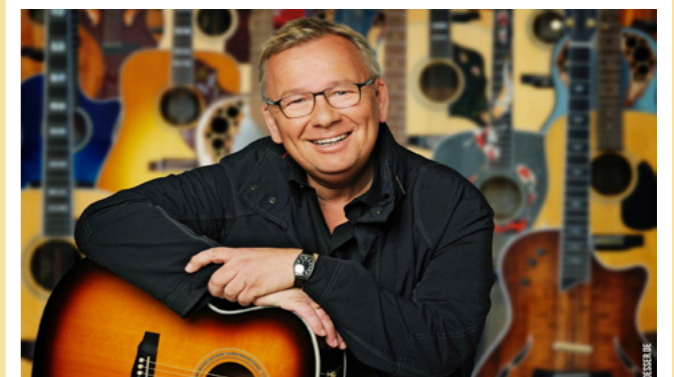
Freizeit-Zentrum-Xanten Sommer Open Air