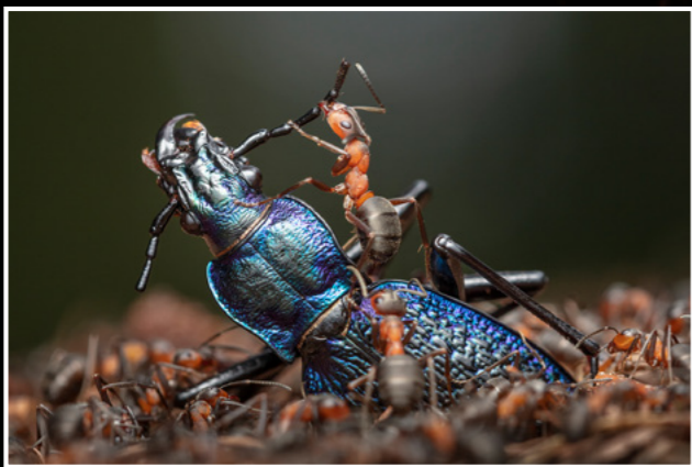
Gasometer Oberhausen ©Ingo Arndt - Waldameise