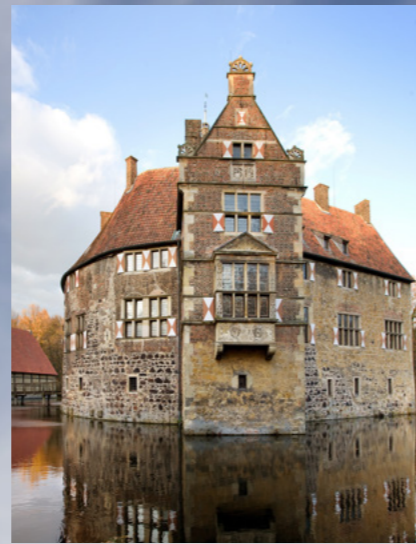
Burg Vischering in Lüdinghausen