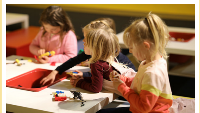
LEGO® Fan Ausstellung im Maxipark Hamm