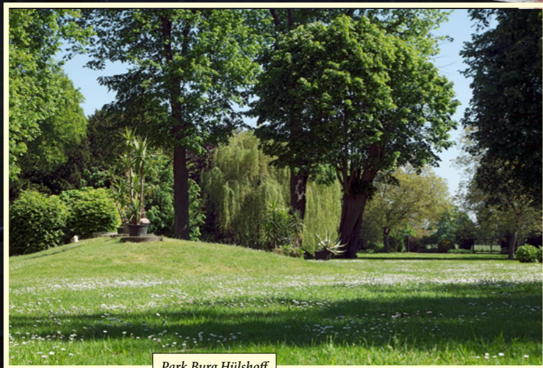
Park Burg Hülshoff