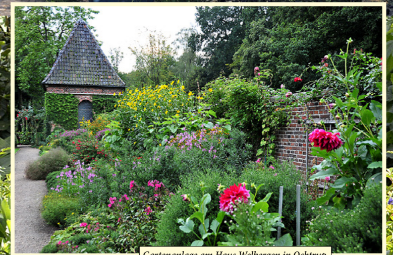
Gartenanlage am Haus Welbergen in Ochtrup