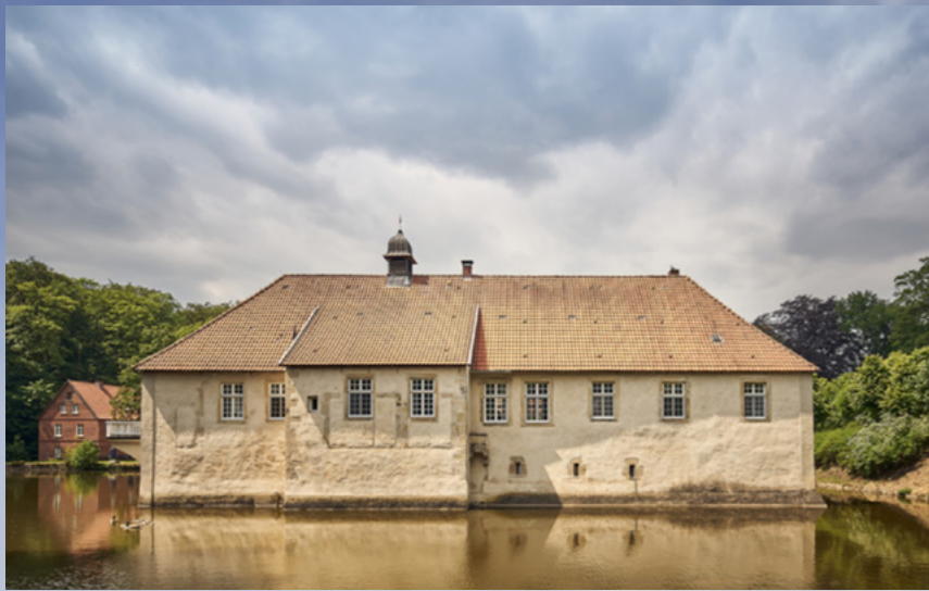
Wasserschloss Haus Marck in Tecklenburg