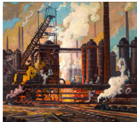
Fritz Gärtner: Hochofenabstich, Öl auf Hartfaser, 1924

Die Schwerindustrie des Ruhrgebiets übte seit dem späten 19. Jahrhundert eine große Faszination auf Kunstschaffende aus. Die neue Sonderausstellung »Das Land der tausend Feuer, Industriebilder aus der Sammlung Ludwig Schönfeld« ist die erste Ausstellung des Ruhr Museums zum Bild des Ruhrgebiets in der Kunst und lädt dazu ein, das Ruhrgebiet durch die Augen von Künstlern und einigen Künstlerinnen zu entdecken, die die massiven Veränderungen der Region zu verschiedenen Zeiten und in unterschiedlichen Stilen dokumentierten. Sie ist bis zum 14. Februar 2026 in den spektakulären Kohlenbunkern auf der 12-Meter-Ebene des Ruhr Museums auf dem UNESCO-Welterbe Zollverein zu sehen.