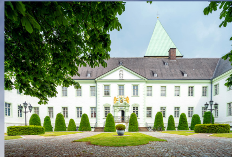
Abtei Liesborn in Wadersloh