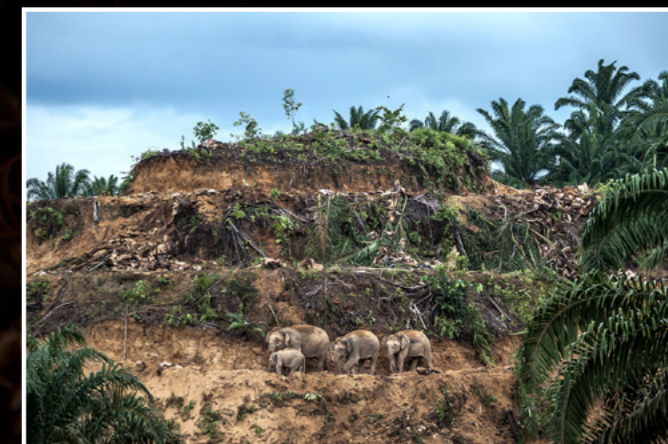
Gasometer Oberhausen ©Aaron-Bertie Gekoski - Elefanten auf Palmölplantage, Borneo